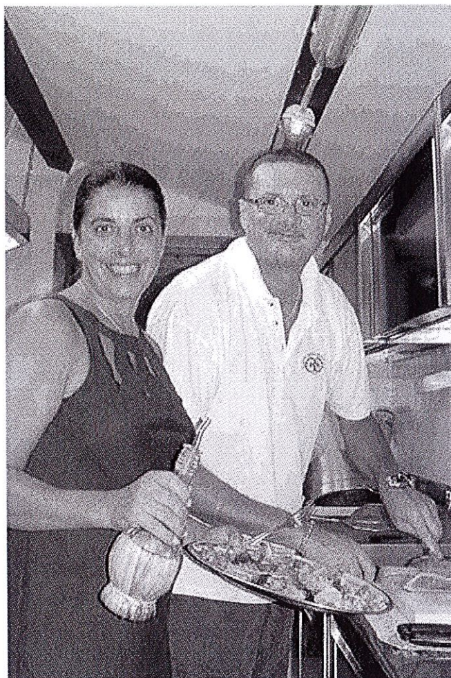
TRADIZIONE E INNOVAZIONE La cucina dell'agriturismo Due Ruote: una delle due strutture premiate in provincia di Grosseto

Ruote per l'importante riconoscimento ottenuto a livello nazionale, «che dimostra come la scelta del percorso degli esercizi consigliati sia un volano importante per sviluppare turismo di qualità e allo stesso tempo sostenibile. Due elementi imprescindibili all'interno di un'area protetta». Nella circostanza il presidente ricorda come proprio nell'ultima seduta del consiglio direttivo dell'Ente parco, è stata approvata una convenzione con Legambiente Turismo per fare promozione in sinergia. «Una opportunità anche per gli esercizi consigliati che potranno aderire all'accordo, e quindi al circuito dell'associazione», ha sottolineato Venturi.